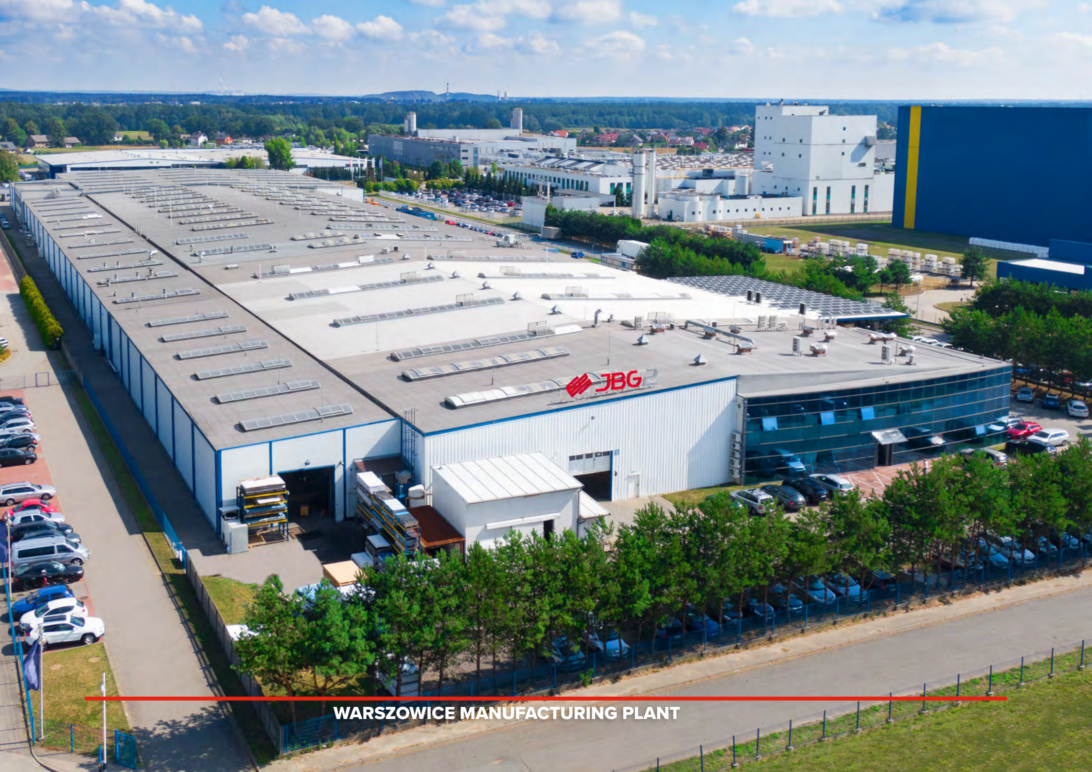
WARSZOWICE MANUFACTURING PLANT